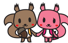
北海道信用保証協会PRキャラクター オーエンくん シエンちゃん

お申込み FAXの場合、参加申込書にご記入のうえ下記FAX番号までお送りください。 メールの場合、参加申込書の情報を本文にお書きのうえ、下記メールアドレスまでお送りください。受付後、担当者からメールにてご連絡いたします。