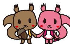
北海道信用保証協会PRキャラクター オールエンくん シエンちゃん

お申込み FAXの場合、参加申込書にご記入のうえ下記FAX番号までお送りください。 メールの場合、参加申込書の情報を本文にお書きのうえ、下記メールアドレスまでお送りください。受付後、担当者からメールにてご連絡いたします。